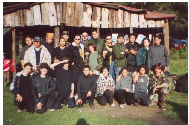
Gracias a Todos y Nos Vemos en Marzo !!!!!...

A pesar de las muchas y dolorosas ausencias a este campamento, y aunque la temprana caída de la noche nos impidió concluir nuestro itinerario, éste campamento fue todo un éxito, gracias a todos y cada uno de los participantes, gracias a los Instructores Invitados por su apoyo desinteresado, y gracias a los padres de familia que confiaron en sus hijos y en esta Dirección General, ya que sin su apoyo, habría sido imposible llevar a cabo este evento.