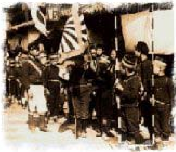
El naciente militarismo japonés, 1905