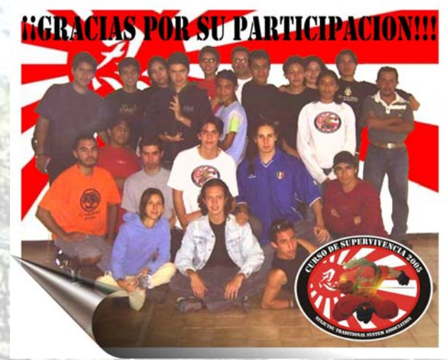
Diseño De Logotipo: Alejandro Díaz Flores

entrenamiento en el Parque Estado De México, Naucalli, para la entrega de Constancias.